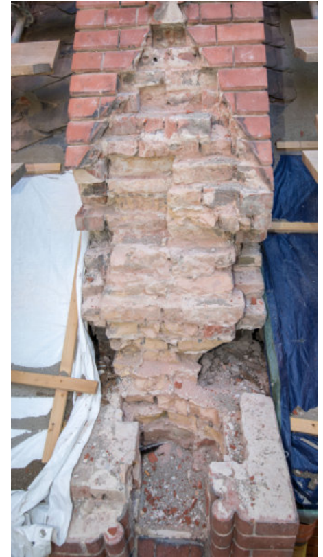
Pfeilertürmchen vor dem Wiederaufbau

Vor allem im zweiten Bauabschnitt traten größere Schäden auf. Die