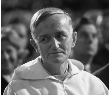
Frère Roger Schutz bei der Verleihung des Friedenspreises des Deutschen Buchhandels

Vor 21 Jahren, am 16. August 2005, wurde der Gründer der ökumenischen Kommunität von Taizé ermordet.