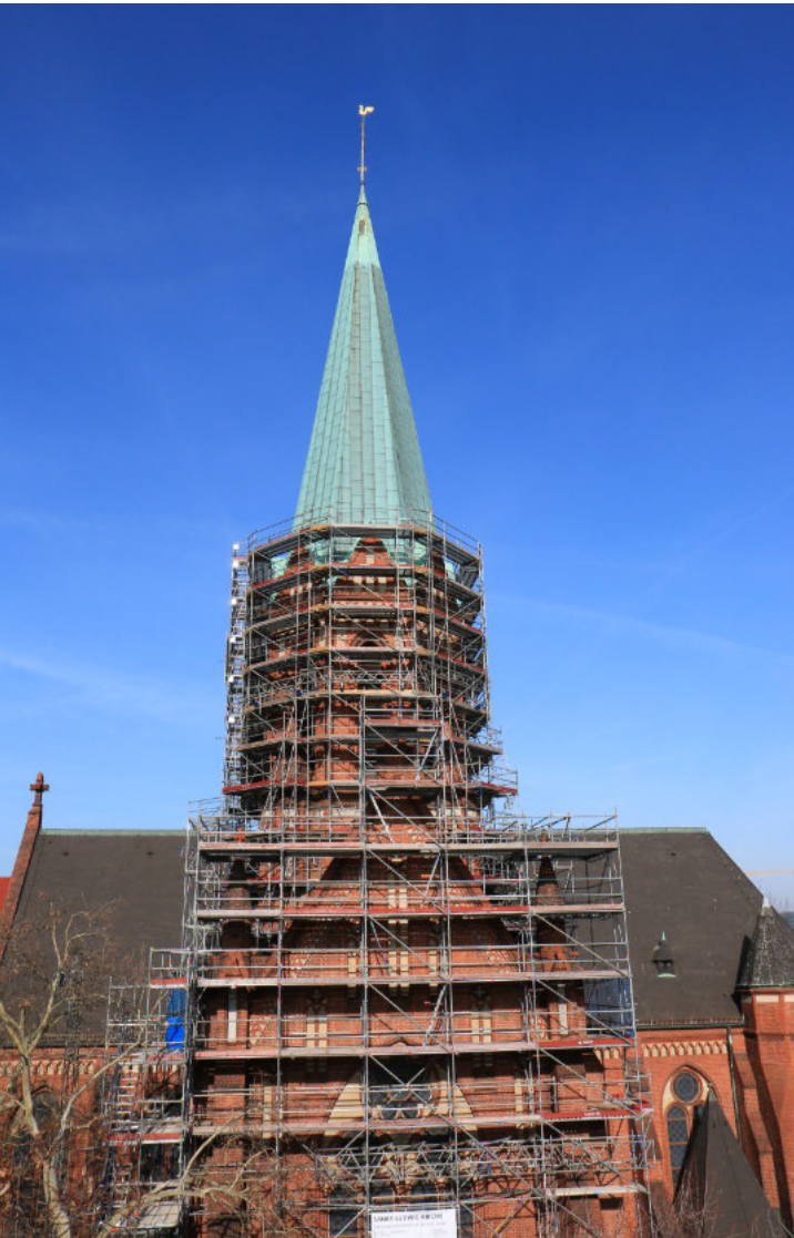
Erster Bauabschnitt St. Ludwig 2019

Die Arbeiten begannen noch unter den Franzis-