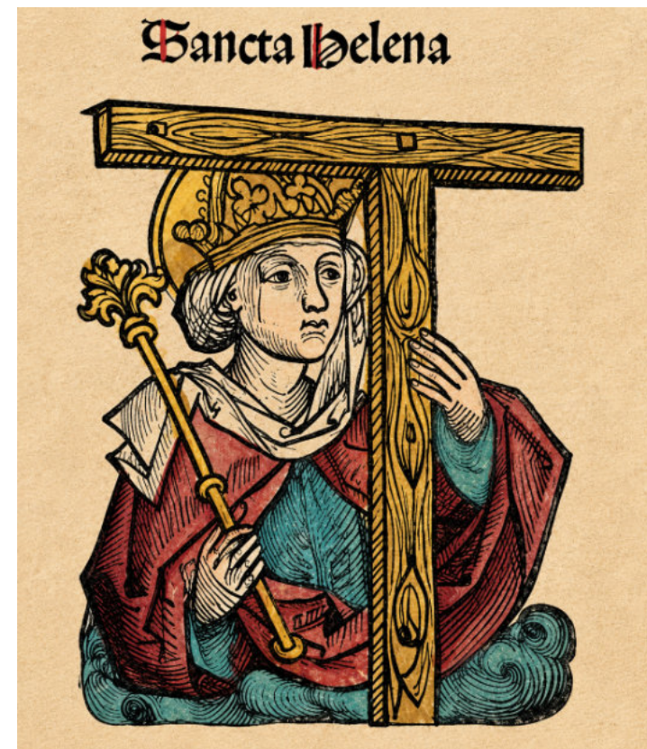
Die Heilige Helena in der Nürnberger Chronik von 1493

Gedenktag unserer Pfarrpatronin, der Heiligen Helena, ist der 18. August.